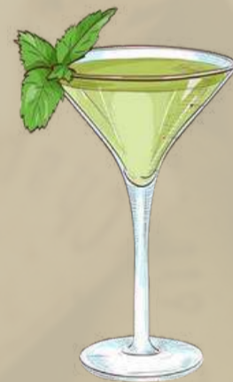
Grasshopper Sweet and Minty

Crème de menthe, crème de cacao, and cream.