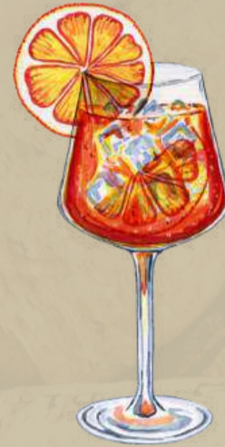
Aperol Spritz Light and Bubbly