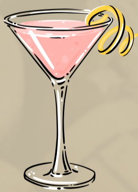
Cosmopolitan Bright and Tangy