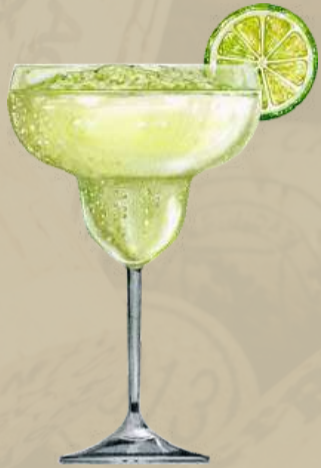
Margarita Zesty and Refreshing