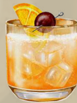
Old Fashioned Smooth and Timeless