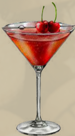
Manhattan Zesty and Refreshing

Rye whiskey, sweet vermouth, and bitters.