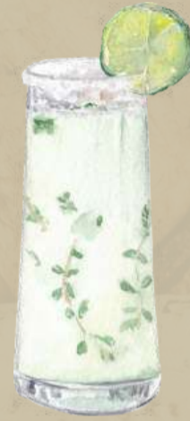
Mojito Fresh and Invigorating