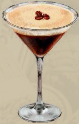
Espresso Martini Bold and Invigorating

Vodka, fresh espresso, and coffee liqueur.